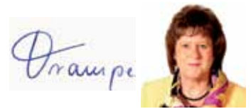
Annegret Trampe Bürgermeisterin Diepenau