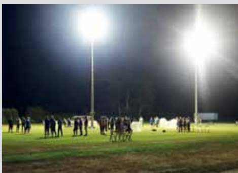
MTV Diepenau feierte Jubiläum: 50 Jahre Flutlichtturnier Seite 6