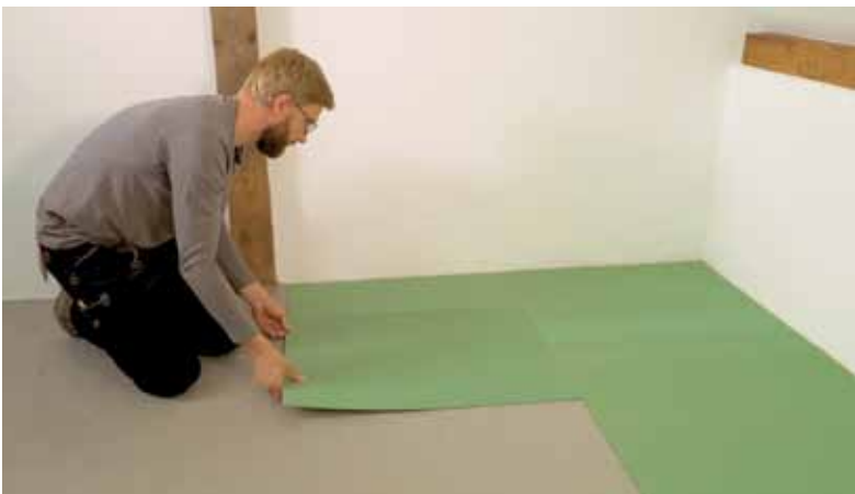
Bauherren legen Wert auf ökologische, baubiologisch hochwertige Materialien wie die grüne Trittschalldämmung aus Holzfaser.

Bauen und dämmen mit Holz bewähren sich als sehr einfache Maßnahme zum Klimaschutz. Statt aus fossilen endlichen Rohstoffen wird die grüne Trittschalldämmung aus Holzfaser, also aus nachwachsenden Rohstoffen, und ohne bedenkliche Zusätze hergestellt. Bäume spalten bei der Fotosynthese CO 2 . Sauerstoff geben sie in die Atmosphäre ab, das Holz bindet den Kohlenstoff. Durch die Verwendung als Holzfaser-Dämmstoff bleibt dieses CO 2 dauerhaft gespeichert. Erhältlich ist die grüne Trittschalldämmung aus Holzfaser im gut sortierten Baumarkt, durch das handliche Format passen die Platten in jeden Kofferraum.