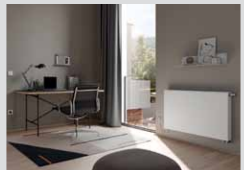
Renovierung: Wärmepumpe und Heizkörper kombinieren? Seite 12